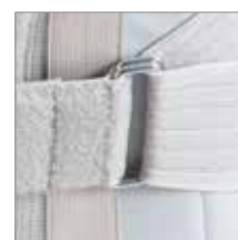
GIRO SEMPLICE PER MAGGIORE SCORREVOLEZZA E FACILITÀ DI INDOSSAMENTO