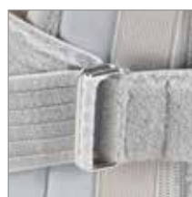
GIRO DOPPIO PER BLOCCARE LA BRETELLA

POSSIBILITÀ DI UTILIZZO PERSONALIZZATO DELLE FIBBIE RETRO: