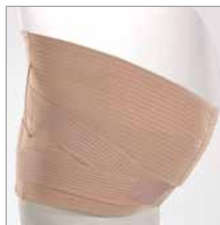
DOPPIA FASCIA SPECIALE

ALTEZZE retro cm 32 e davanti doppia fascia regolabile da cm 20 a 32. TESSUTI bendaggio elastico Rigato traspirante. Bendaggio elastico Microgrip per le due fasce orizzontali anteriori. STECCATURA quattro 2005 cm 29, di cui le 2 paravertebrali estraibili, ricoperte con strisce di gallone rigido. CHIUSURA velcro. COLORE ● nudo. AGGIUNTIVO predisposto per la Pelotta TLM (vedi pag. 53).